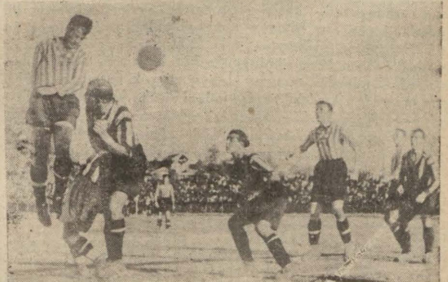
Dünkü maçın heyecanlı bir sahne

Misafir takım yorulmadan uğraşmış didinmesine rağmen dünkü maçı 3-0 kaybetti