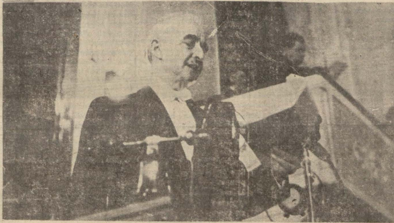
Millî Şef Mecliste nutuk irad ederlerken

“Kahraman kıymetli ordumuzu hazır bulunduruyoruz,,